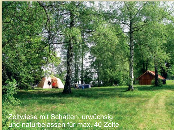
Zeltwiese mit Schatten, urwüchsig und naturbelassen für max. 40 Zelte

Webcam unter www.seehausen-am-staffelsee.de